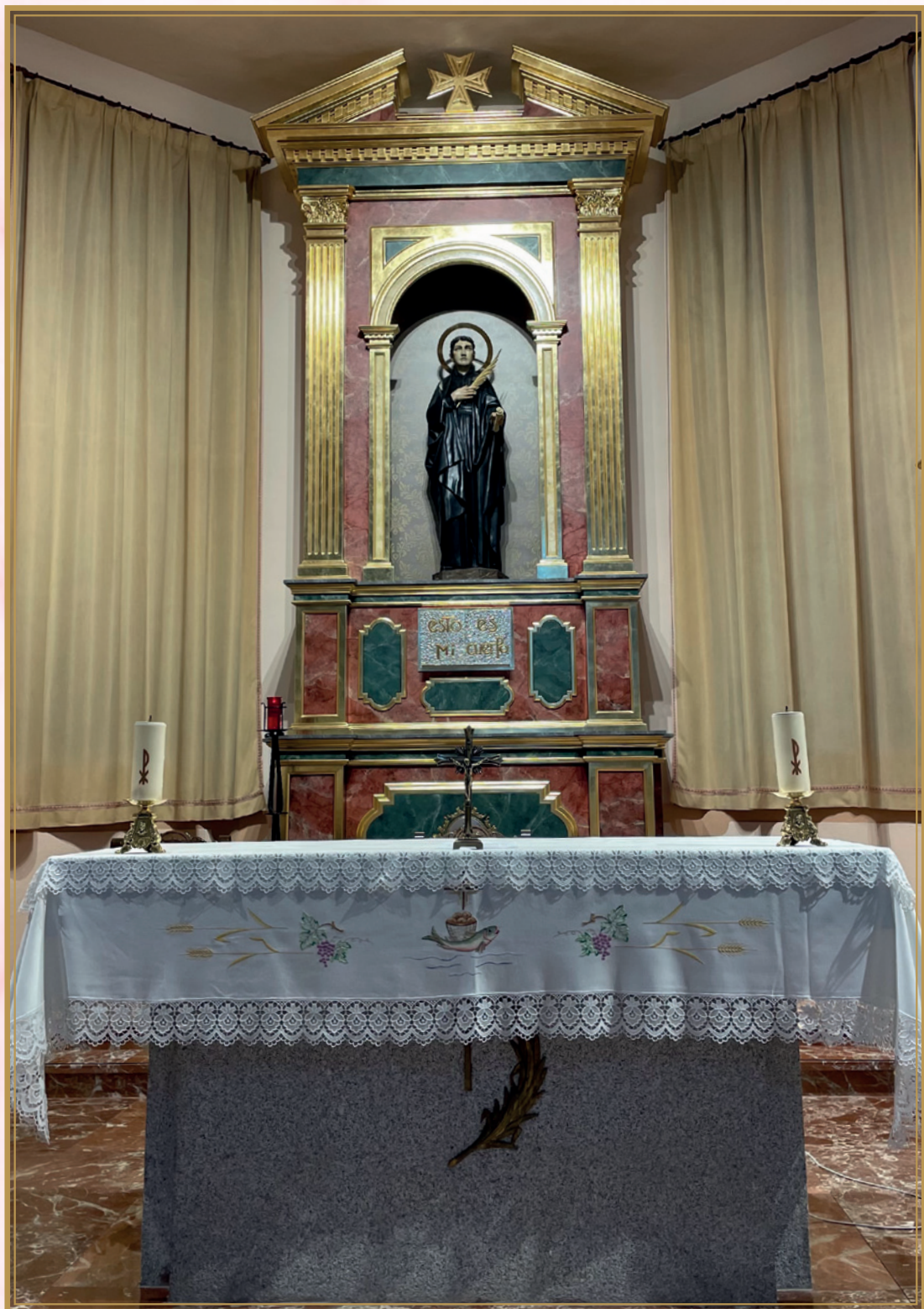
Retablo Iglesia Beato Francisco Pérez de Godoy